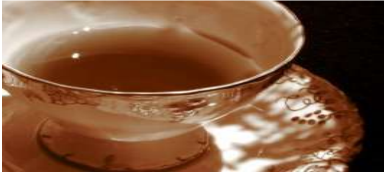
مشروب القسط الهندي