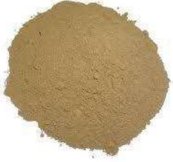
مسحوق وعيدان القسط الهندي