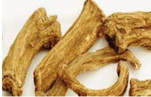
جذور القسط الهندي

وفي اللغة السنسكريتية تسمى جذور القسط: " كوشتا".. ولكن الاسم التجاري: " كوت" أو " الكوت المر"، وهذا الاسم معروف في شبه القارة الهندية.