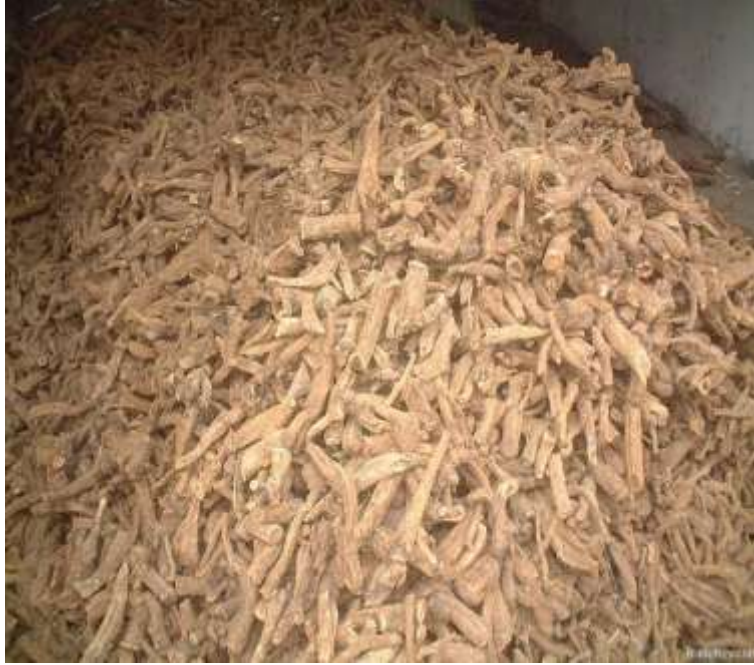
محصول القسط الهندي